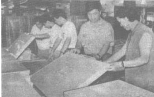
△市商业大厦一楼坚持“同类产品品种全，同类产品价格低”的经营方针，收到了明显的经济效益。今年1—8月份，已完销售总额135万元，利润22万元，分别比去年同期增长215%和250%。